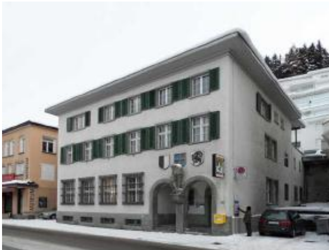
Ansicht von Südosten