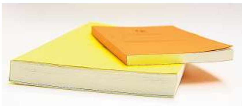
Schwergewicht: Die (gelbe) Botschaft der Regierung zur Bündner NFA im Grössenvergleich zu einer herkömmlichen Botschaft.