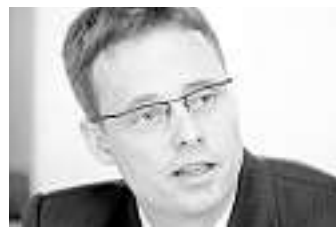
Von Patrik Degiacomi*

Mit einem Nein zur NFA kann verhindert werden, dass Volksschule, Familienförderung und Soziales je nach Wohnort unterschiedlich ausgestaltet werden.