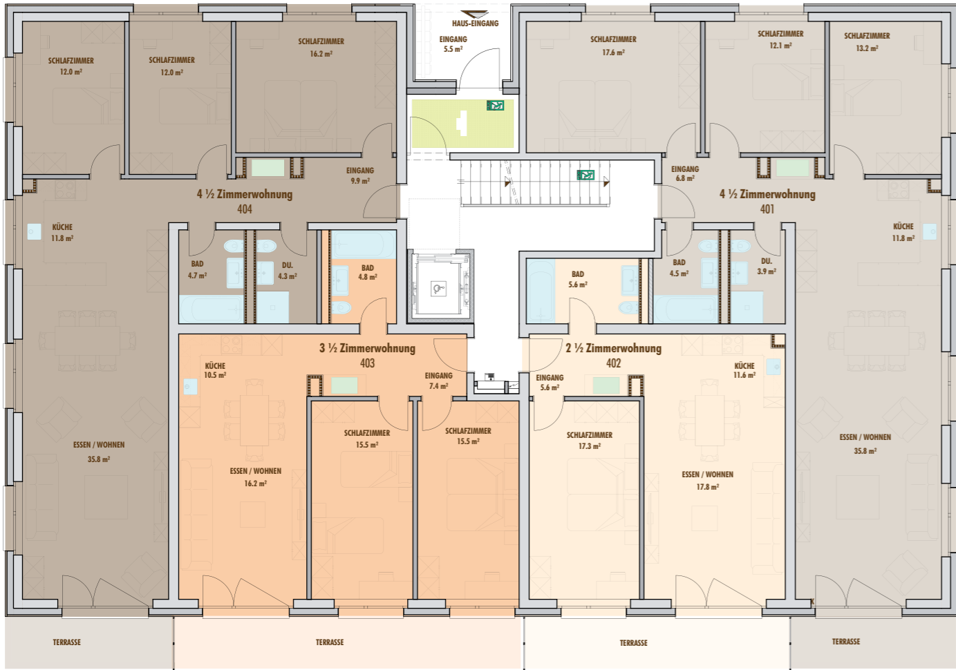
4 1/2 Zi-Wohnung W-Nr. 404