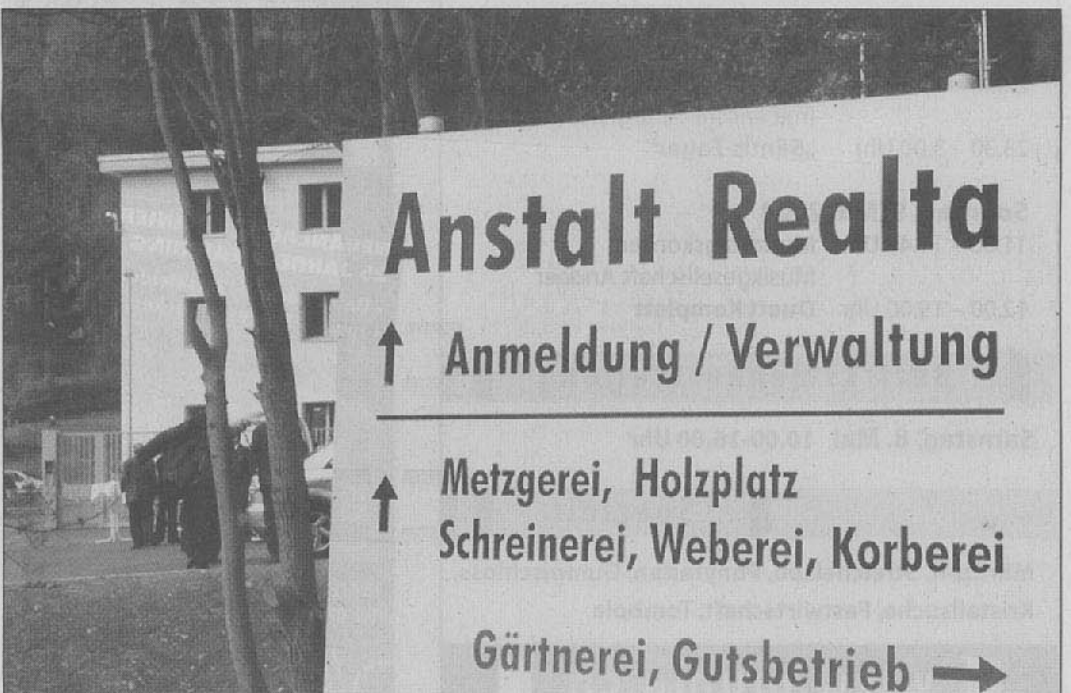
An la parschùn da Riòlta vean luvro.

La sonda digls 8 da matg, da las 10.00 antocen las 16.00 à liac igl gi da las portas aviertas da la parschùn da riòlta. Que gi à ear la publizitad la pussevladad da vurdar que bietg. Tgi ca e aresto a Riòlta à egna structura digl gi completa. Qua vean par exaimpel luvro an l'orticultura, segl plaz da far lena dad arder, an la meztga, segl bagn puril cantunal, near c'ign s'ocupescha sco canastrer.