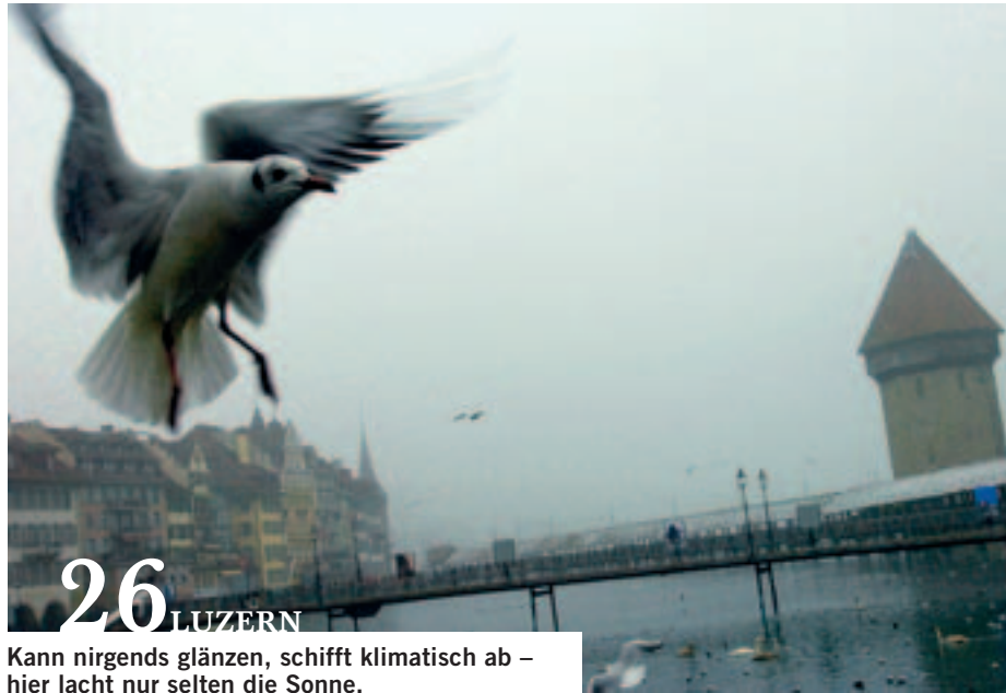
26 LUZERN Kann nirgends glänzen, schiff klimatisch ab – hier lacht nur selten die Sonne.

wussten nur politische Experten, dass die Schweiz das Ständesreferendum kennt. Dieses Instrument gibt es zwar seit der Revision der Bundesverfassung von 1874, aber eingesetzt worden war es noch nie. Mit dem Ständesreferendum kippten die Kantone das Steuerpaket des Bundesrates, der auf ihre Kosten Hauseigentümer und Ehepaare tiefer besteuern wollte. Die Bündner Regierungsrätin und Präsidentin der Finanzdirektorenkonferenz, Eve-