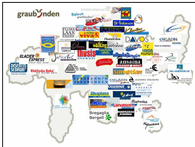
Abbildung 3: Illustration der Reizüberflutung

Das Problem der Reiz- und Informationsüberflutung wird sich in Zukunft noch stärker akzentuieren. In Abbildung 3 wird dieses Problem mit einem Auszug von Tourismusmarken aus Graubünden illustriert.