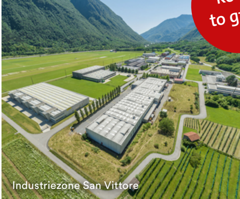
Industriezone San Vittore