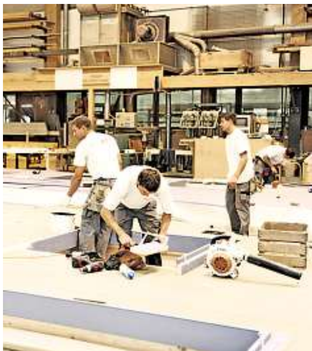
Erfolg haben dank Teamarbeit.

Neu kann man den beruflichen Einstieg in die Holzbranche mit einer zweijährigen Ausbildung zum Holzbearbeiter EBA starten. Für diese Ausbildung stehen zwei Fachrichtungen zur Wahl: Industrie oder Werk & Bau. Bei beiden Fachrichtungen ist eine Staplerfahrausbildung im Lehrgang integriert, was bei einer Stellensuche nach der Ausbildung Vorteile bringt.