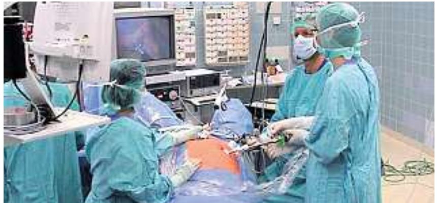
Informatik ist überall: Auch Geräte im Operationssaal funktionieren nicht ohne!

Mediamatiker und Mediamatikerinnen sind überall tätig, wo der professionelle Umgang mit Informationen und Medien gefragt ist. Sie erstellen Bildmaterial, Filme, Musik-, Text- und Tondokumente und binden diese in Internetauftritte ein. Dazu verfügen sie über Kenntnisse in den Bereichen Multimedia, Gestaltung und Design, Marketing und Kommunikation sowie im Projektmanagement. Sie gestalten und aktualisieren Homepages, bereiten Informationen zu Animationen auf und stellen sie auf der Benutzeroberfläche kundengerecht, verständlich und lesefreundlich dar. Für Anlässe produzieren diese Spezialisten Prospekte, Pressemitteilungen, Präsentationen und Dokumentationen. Sie beginnen mit der Produktion am Bildschirm, geben die Texte ein, ordnen Dokumente und erstellen das