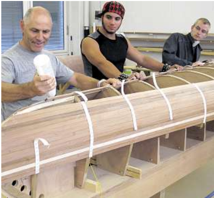
Beim gemeinsamen Bau eines Kanus soll die Teamfähigkeit gefördert werden.

Von Paul Schwendener, Amtsleiter, Amt für Industrie, Gewerbe und Arbeit