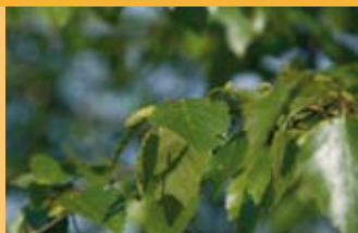
Birke Betula pendula