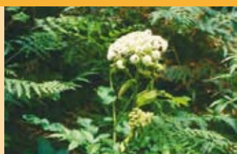
Wilde Engelwurz Angelica sylvestris