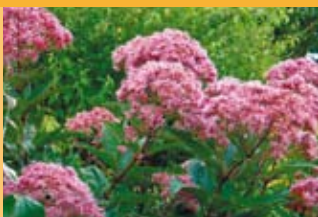
Gewöhnlicher Wasserdost Eupatorium cannabinum