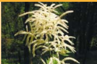
Waldgeissbart Aruncus dioicus