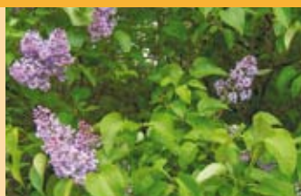
Gemeiner Flieder Syringa vulgaris