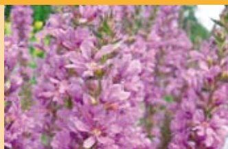
Blutweiderich Lythrum salicaria