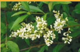
Gemeiner Liguster Ligustrum vulgare