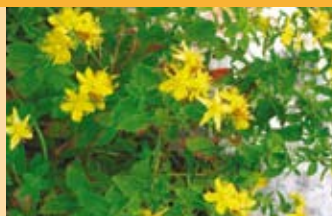
Johanniskraut Hypericum perforatum