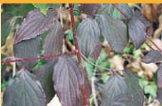
Roter Hartriegel Cornus sanguinea