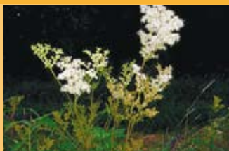
Mädesüss Filipendula ulmaria