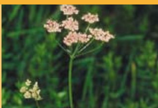
Grosse Bibernelle Pimpinella major