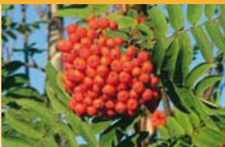
Vogelbeere Sorbus aucuparia