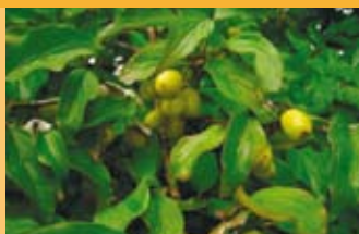
Kornelkirsche Cornus mas