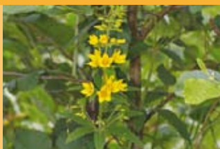
Gewöhnlicher Gilbweiderich Lysimachia vulgaris