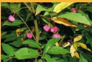
Pfaffenhütchen Euonymus europaeus