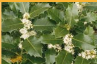
Stechpalme Ilex aquifolium