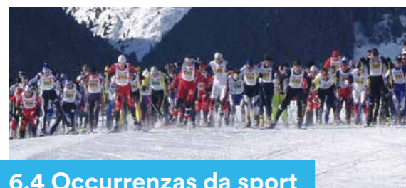
6.4 Occurrenz da sport

Sch'igl è – per motivs dal sport – indispensabel che atletas ed atlets che meritan da vegnir promovids visitian ina scola da sport extrachantunala e sch'i n'exista nagina purschida chantunala correspudenta, po il chantun surpigliar ils custs per ils daners da scola effectivs per frequentar ina scola extrachantunala che porta il label da Swiss Olympic.