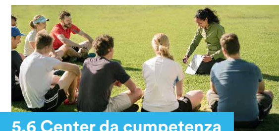
5.6 Center da competenza per il sport

Cun il «Plan sectorial Velo» existan dapi l'onn 2019 las basas planisatoricas per promover en moda persistente il velo sco med da traffic ecologic, efficient e saun per il traffic quotidian e da temp liber.