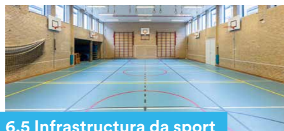
6.5 Infrastructura da sport

Il chantun po sustegnair occurrenz internaziunals grondas. Il zercladur 2014 ed il favrer 2017 ha il cussegl grond concedì – sin basa da la Lescha davart il svilup economic – contribuziuns chantunals per realisar ils campiunadis mundials da skis alpin da la FIS 2017 a San Murezzan e per renovar la pista da la cuppa mundiala a San Murezzan. 20 Er ils campiunadis mundials da velo da muntogna da la UCI 2018 a Lai èn vegnids sustegnids cun ina contribuziun chantunala. 21 L'Uffizi federal da sport elavura actualmain ina strategia per promover occurrenz grondas. Quella è d'importanza er per il chantun Grischun.