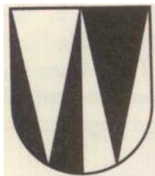
Der Buchstabe W und eine mögliche heraldisierte Form im Wappenschild.

Buchstaben und Zahlen sind in der Heraldik ebenfalls verpönt. Die Wappen entstanden zu einer Zeit, in der die Kenntnis des Lesens bei den Kreisen, die mit Heraldik vorzugsweise in Berührung kamen, also den Kriegersleuten, nur gering verbreitet war. Wappen sollten deshalb durch Farben und Bilder sprechen und nicht durch Buchstaben und Zahlen. Buchstaben können oft auch problemlos heraldisiert werden.