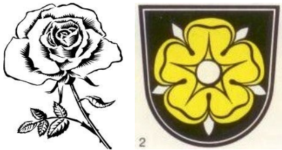
Die natürliche Rose und ihr stilisiertes Pendant im Wappenschild.

Aus Gründen der Fernwirkung sollten die Figuren im Wappen stilisiert werden. Durch Vereinfachung und Übertreibung der charakteristischen Kennzeichen werden Bilder auch auf weite Entfernung erkennbar. Bestimmte, häufig vorkommende Figuren erhielten in der Heraldik eine typische Form (z. Bsp. Löwen, Adler, Rosen, Lilien), die sich teilweise von den Umrissen der natürlichen Vorbilder sehr weit entfernt haben. Berge sollten übrigens niemals natürlich dargestellt werden.