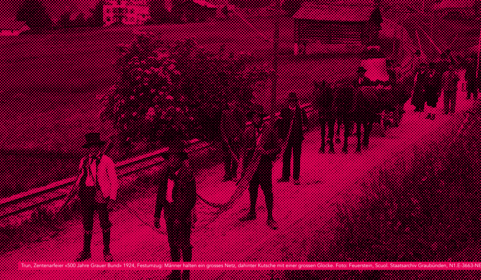
Trun, Zentenerfeier «500 Jahre Grauer Bund» 1924, Festumzug: Männer halten ein grosses Netz, dahinter Kutsche mit einer grossen Glocke. Foto: Feuerstein, Scuol, Staatsarchiv Graubünden, N1.E-3663-NEN