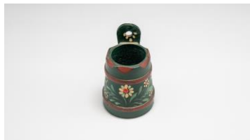
Riccarda Flütsch Locomotivista, regiun Alvra

«In pitschna brocca da lain cun maletgs.»