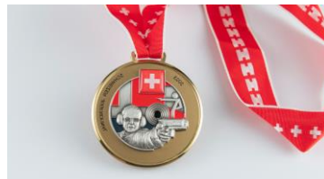
Ilaria Barandun Sportista juniora, regiun Il Plaun

«In pitschna brocca da lain cun maletgs.»