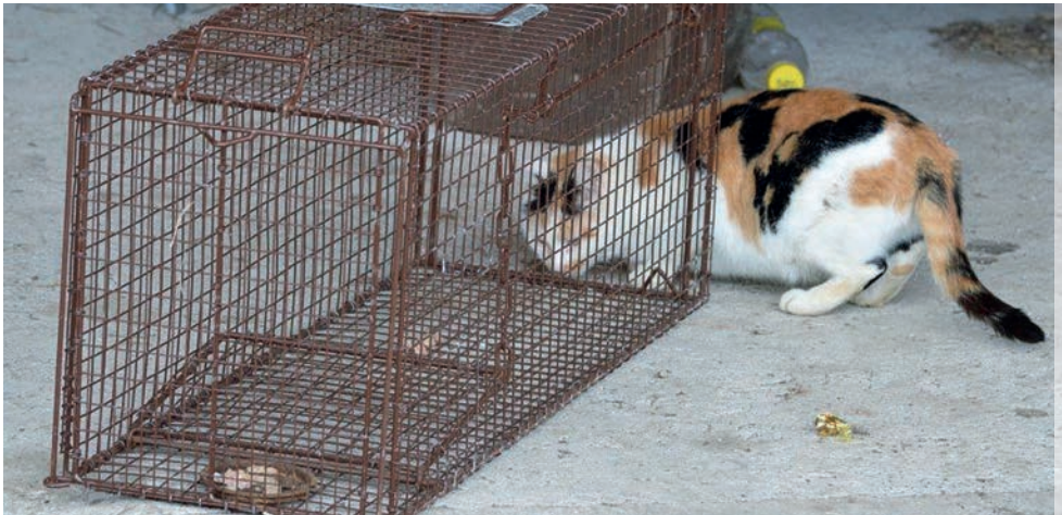
Fangkäfig für verwilderte Katzen