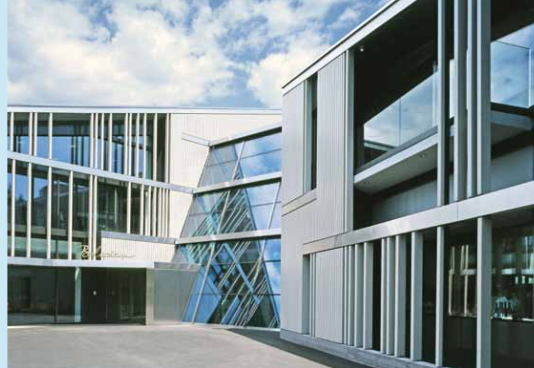
Hotel Belvoir, ZH-4291