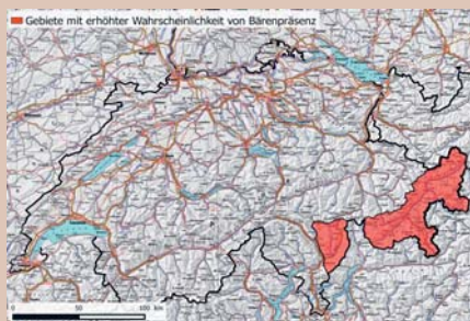
Seit 2005 sind der südliche- und der östliche Teil Graubündens, sowie der Osten des Tessins Streifgebiet vereinzelter Bären. (Karte: AGRIDEA)

Der Braunbär ist ein Allesfresser. Er frisst Früchte und sonstige Pflanzenteile, aber auch Insekten, Wild und vereinzelt Nutztiere wie zum Beispiel Schafe oder junge Kälber. Bienenvölker sucht er vor allem wegen den eiweisshaltigen Larven auf. Dank ihres ausgezeichneten Geruchsinns können Bären die Bienen von weitem aufspüren. Im Sommer 2007 kam es in der Schweiz zu den ersten Schäden an Bienenständen. Seither werden immer wieder Bienenhäuschen, bzw. Bienenstände von Bären geplündert und teilweise stark beschädigt.