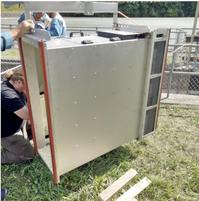
Das neue kompakte Fischzählsystem "Riverwatcher" kurz vor dem Einbau.