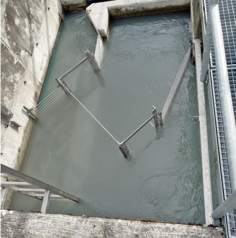
Leit- und Hälterungseinrichtung für das Fischzählsystem "Riverwatcher" im obersten Becken der Fischtreppe des KW Reichenau.