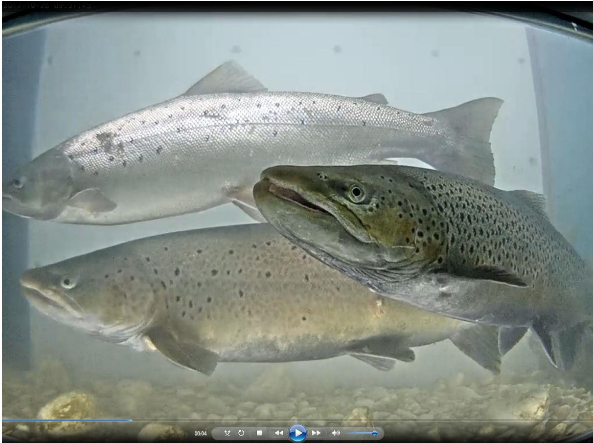
Screen-Shot einer Videosequenz des neuen Zählsystems ("Riverwatcher"): 3 aufsteigende Bodensee-Seeforellen in der Fischtreppe des KW Reichenau (Datum: 8.11.2017)