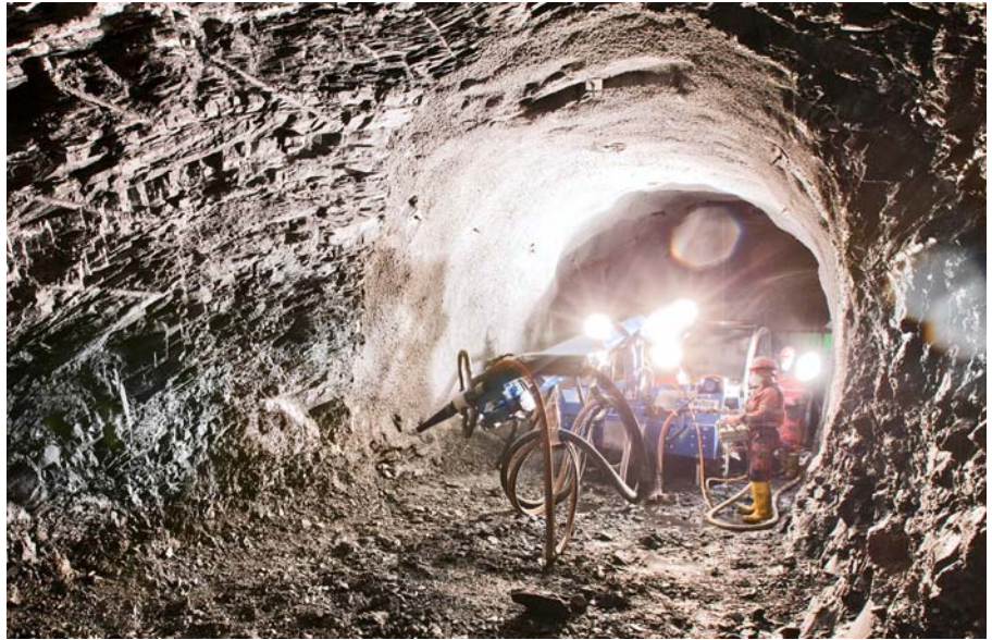
Sicherung des Ausbruchprofils beim Sicherheitsstollen.

Im Sommer 2014 beginnen im Ostteil des Tunnels die Belagsarbeiten. Dabei werden auf die für den Tunnelbau erstellte Betonfahrbahn eine Sickerschicht und eine Fundamentschicht eingebracht. Auf diese erfolgt der Einbau einer Tragschicht, welche zu 80% aus recyceltem Asphaltgranulat besteht. Auch die auf diese Tragschicht einzubauenden Trag- und Binderschichten bestehen zu 60% bzw. 40% aus recyceltem Asphalt. Mit diesem Aufbau trägt das Projekt Umfahrung Küblis wesentlich dazu bei, die beim Strassenbau