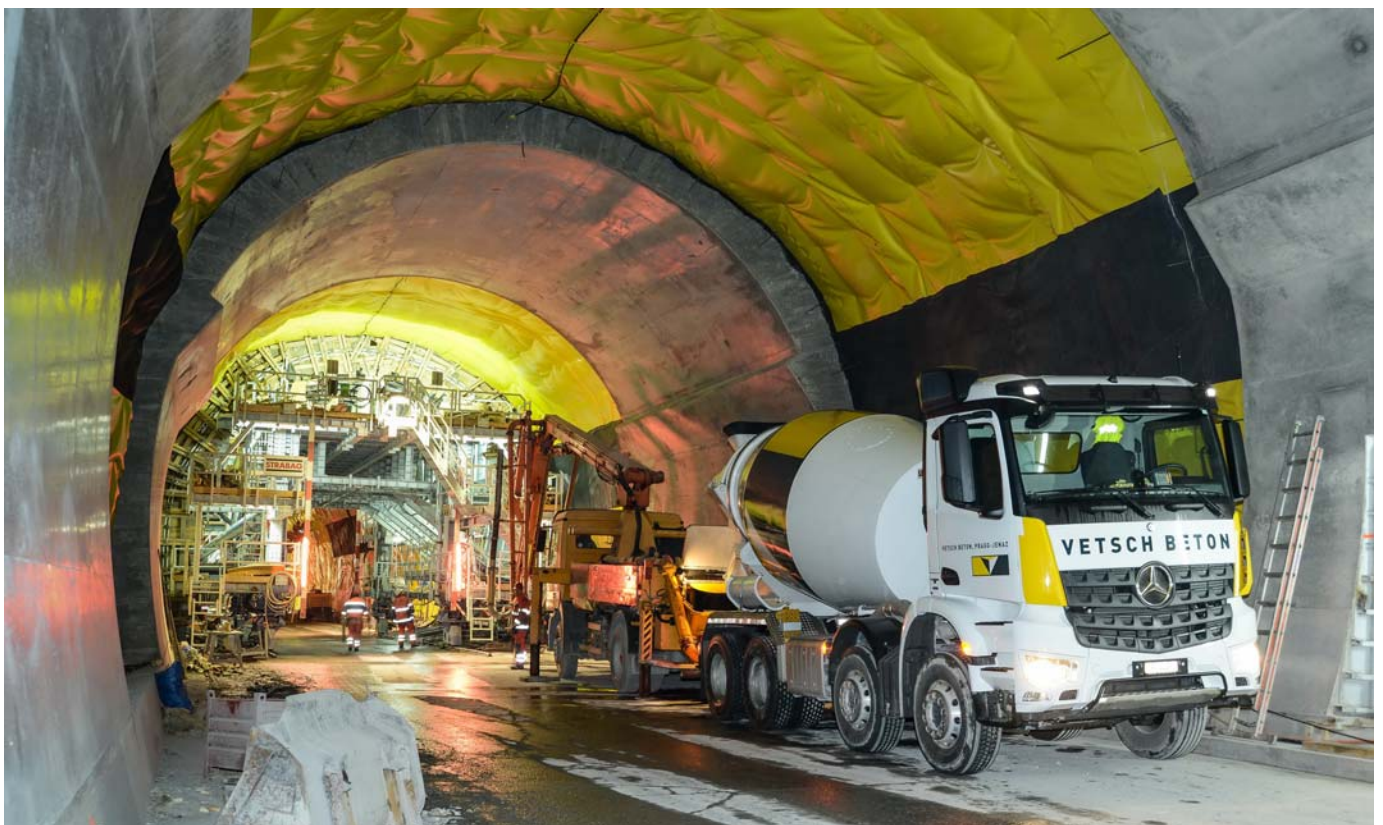
Alternierendes Betonieren des Innenringes in 10 Meter langen Sektionen.

In einem letzten Arbeitsgang werden die Kabelblöcke und die Hydrantenleitung in den Banketten ver-