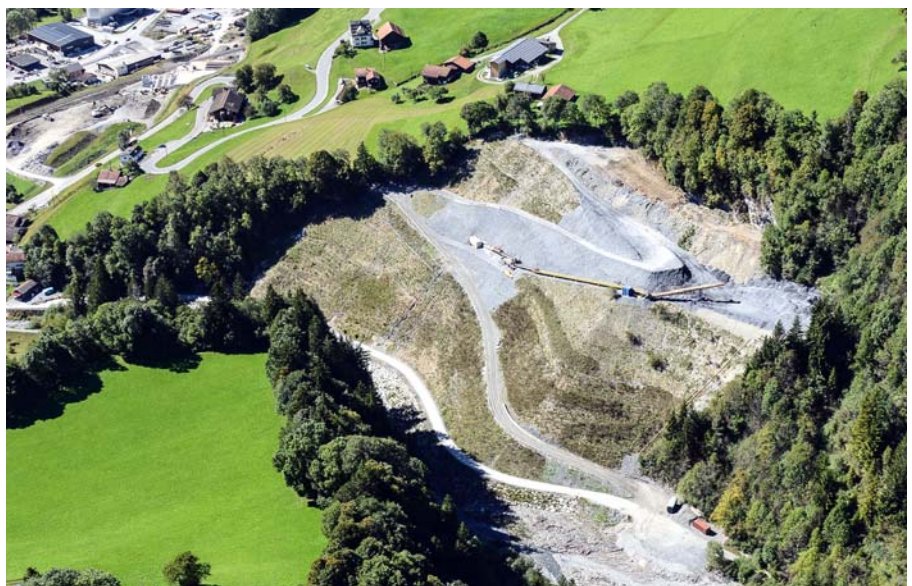
Deponie der 470'000 Kubikmeter Ausbruchmaterial im Schanielatobel.