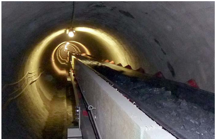
Abtransport des Ausbruchmaterials durch den Schutterstollen ins Schanielatobel.