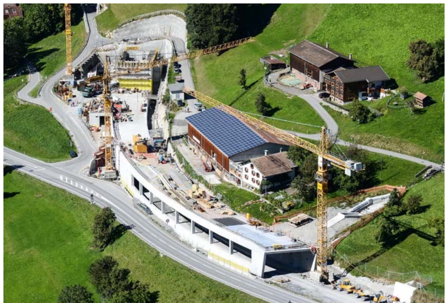
Das Ostportal in Prada im Herbst 2013

Auch beim Ostportal sind die Kunstbauten fertig erstellt und können zu-