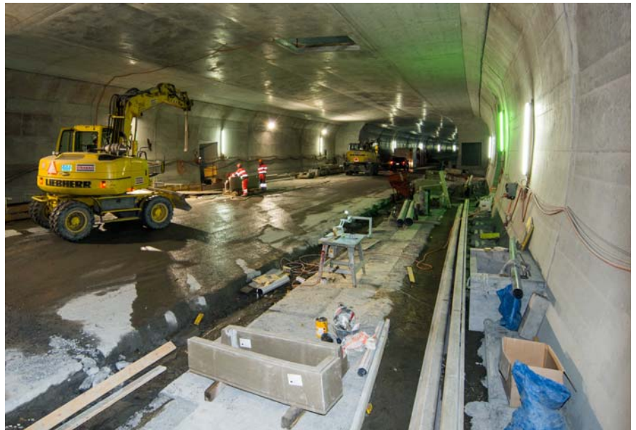
Innenausbau im Bereich einer Ausstellnische.

Die armierten Betonteile werden mit einer Hydrophobierung versehen, um ein tiefes Eindringen des chloridhaltigen Wassers aus dem Tunnelbetrieb in den Beton zu verhindern. Um den Aufwand an Beleuchtungsenergie während des Tunnelbetriebs zu reduzieren, werden die Tunnelwände mit einer weissen unterhaltsfreundlichen Farbe beschichtet. Diese Arbeiten erfolgen jeweils anschliessend an die Belagsarbeiten in ebenfalls zwei Etappen.