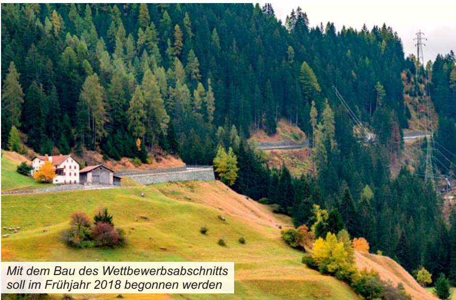
Mit dem Bau des Wettbewerbsabschnitts soll im Frühjahr 2018 begonnen werden

• Nicol. Hartmann & Cie. AG, Chur • Pöyry Schweiz AG, Chur • Fanzun AG dipl. Architekten + Ingenieure, Chur