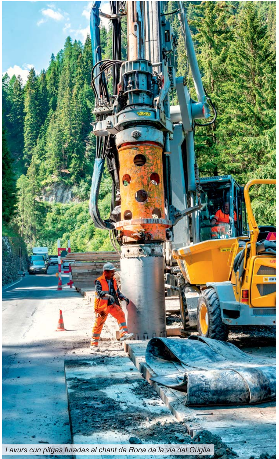
Lavurs cun pitgas furadas al chant da Rona da la via dal Gùgla

Cun las temperaturas pli chaudas crescha er il dumber da plazzals sin vias. La finala profitain nus bain tuts, sche la vasta rait da vias chantunalas è segira e funcziuna. Tuttina pon tals plazzals esser colliads cun restricziuns e retardaments per quella u quel che sto gist spetgar. Ils plazzals sin las vias èn ultra da quai ina ristga d'accidents – betg mo per las participantas ed ils participants dal traffic, mabain er per las lavurantas ed ils lavurants da las interpresas da construcziun da vias e dals servetschs da mantegnimment! Il potenzial da privels vegn savens sutvalità u simplamain resguardà memia pauc. Perquai supplitgain nus las participantas ed ils participants dal traffic d'agir cun responsabladad e da sa cumportar conform a