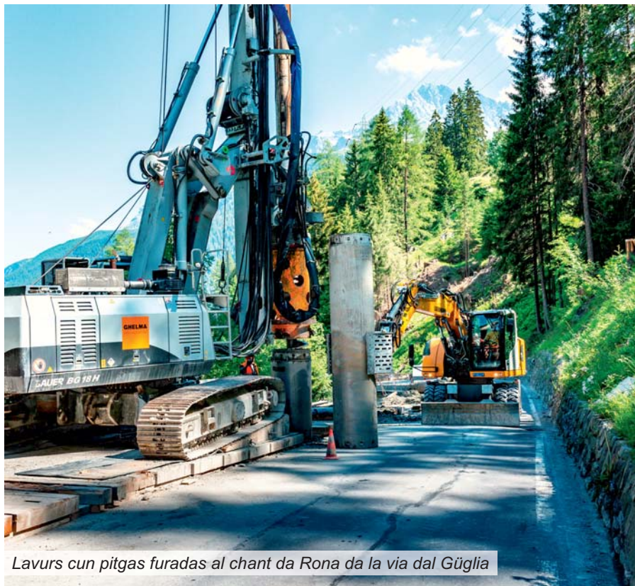
Lavurs cun pitgas furadas al chant da Rona da la via dal Güglia

Datti in plazzal sin mes viadi a la lavur? La charta e la glista da plazzals actuala infurmeschan sut www.strassen.gr.ch cun indicaziuns detagliadas davart las lavurs e davart ils impediments.