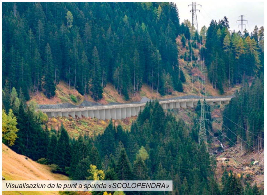
Visualisaziun da la punt a spunda «SCOLOPENDRA»

Il project victur «SCOLOPENDRA» serpegia en moda elegante per lung da la costa stippa sì. Topograficamain resultan duas punts parzias coerentas d'ina lunghezza da circa 350 e 400 meters ch'èn mintgamai furmadas en moda integrala. Las novas construcziuns da punts a spun-