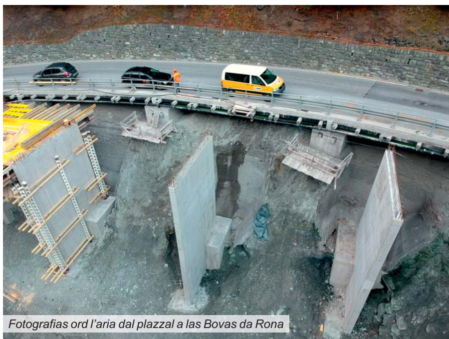
Fotografias ord l'aria dal plazzal a las Bovas da Rona

restricziuns durant la stad e las lavurs pon vegnir cuntinuadas. Las lavurs principalas s'extendan sur quatter onns dal 2017 al 2020. In onn pli tard vegn messa la cuvrada definitiva.