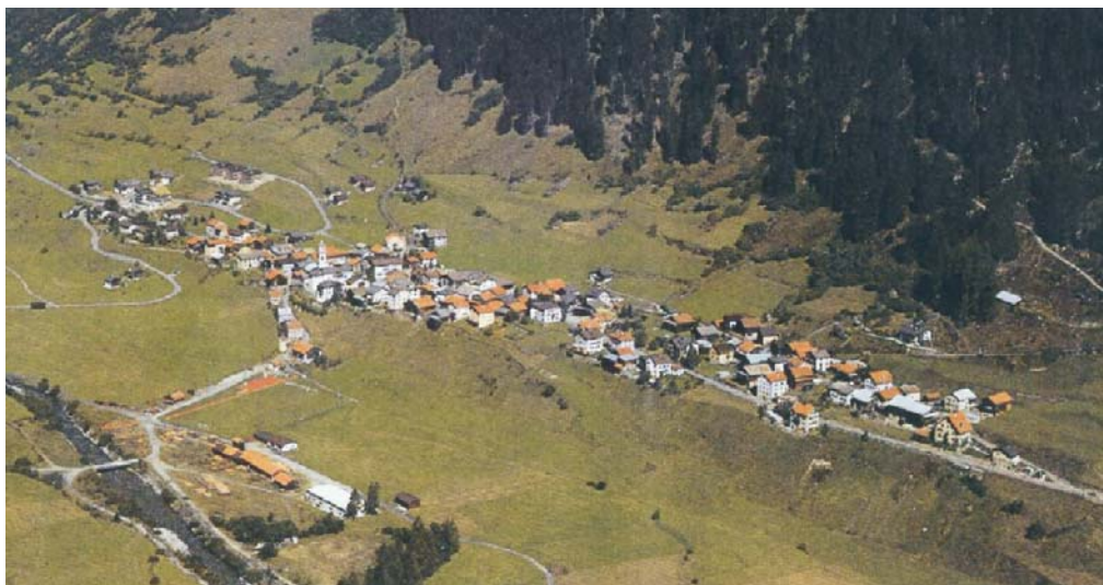
Das langgezogene Strassendorf Tinizong La vischnanca stradala schlunganada da Tinizong

Il nausch stadi da la via dal Güglia pretenda ina renovaziun cumpletta dal trasé da la via a Tinizong. Il medem mument vegn fatg in passape senz' interrupziun tras la vischnanca ed ils conducts d'ovra en il trasé da la via vegnan renovads. Cun optimar il trasé da la via pon ultra da quai vegnir eliminadas diversas stretgas cun blera canera e svapurs intensivas. Las lavurs da construcziun da quel project da via d'ina lunghezza da var 1.4 km che custa var 10.9 milliuns francs duran fin la fin da l'onn 2007.