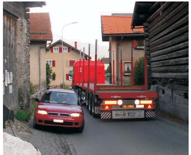
Brems- und Anfahrmanöver bei Engpässen verursachen zusätzliche Abgas- und Lärmemissionen.

bis zur Brücke Val Mulegna aufdrängt. Gleichzeitig erhält Tinizong ein durchgehendes, 1.5 bis 2.0 Meter breites Trottoir bergseits entlang der Hauptstrasse. An verschiedenen Stellen gewährleistet Fussgängerstreifen ein sicheres Queren der Strasse. Die neue Postautohaltestelle vor dem Gemeindehaus erlaubt das Ein- und Aussteigen abseits der Strasse. Dank der Fahrbahnbreite von 6.0 bis 7.0 Meter werden Postauto und Personenwagen problemlos kreuzen können. Die überarbeitete Linienführung des 1.37 Kilometer langen Erneuerungsabschnittes wurde bestmöglich an die bestehenden Gebäude, Mauern und Zu-