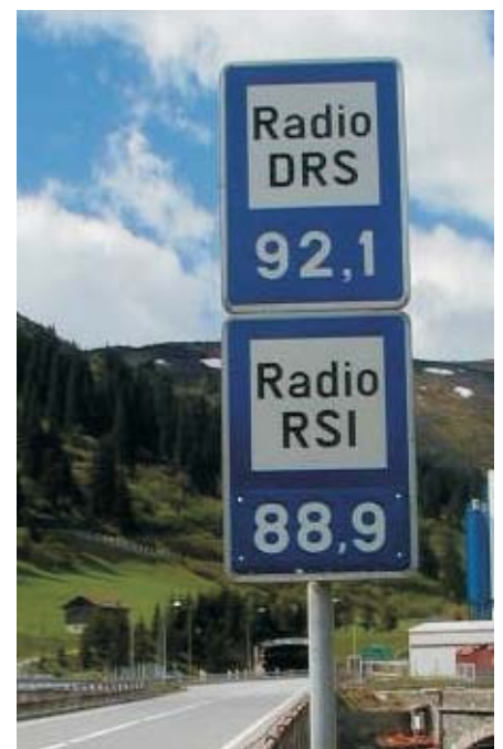
Hinweisschild vor dem Portal des San Bernardino Tunnels auf die empfangbaren Radio-Frequenzen

Nationalstrassen A13 und A28: Lant, San Bernardino, Cassanawald, Traversa, Rofla, Bärenburg, Bargias, Viamala, Crapteig, Isla Bella, Chlus. Hauptstrassen: Trin, Sils i. D., Solis, Alvaschein. (Stand 15.12.2003)