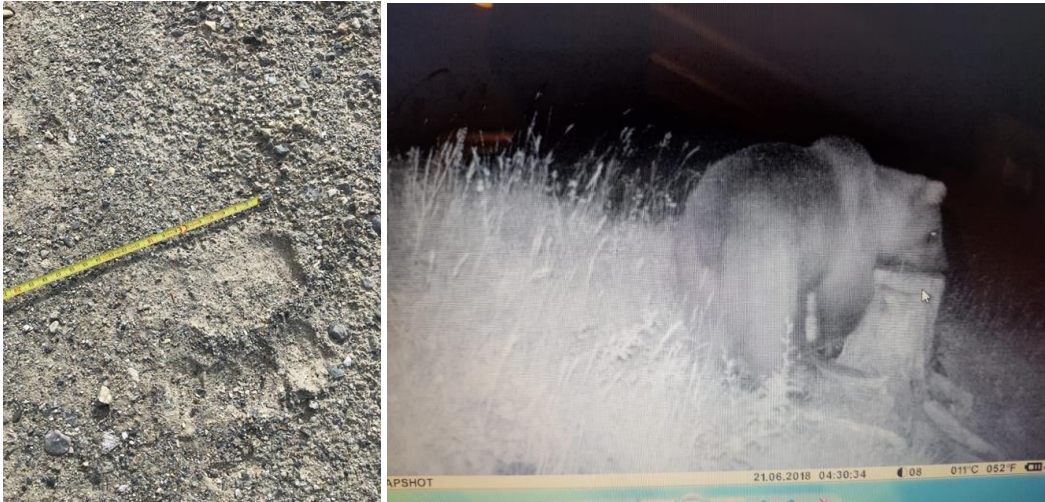
Bilder 1 + 2: Spuren vom 29.5. und Bild Fotokamera vom 21.6. zwischen Tschlin und Martina.