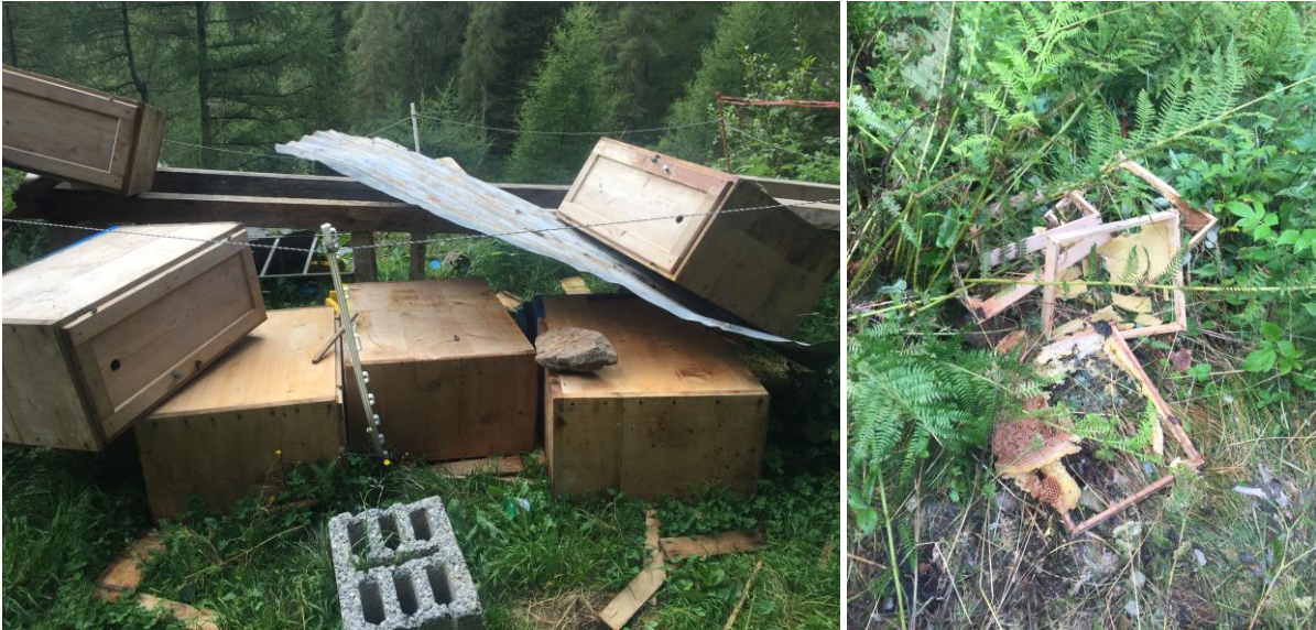
Bild 5 + 6: Schäden an Bienenstöcken im Gebiet Mafisciöi oberhalb von Brusio vom 11.8.

Es bleibt offen, ob immer der gleiche Bär für die zahlreichen Beobachtungen bzw. Hinweise im Unterengadin bzw. Valposchiavo verantwortlich war. Da keine DNA Nachweise gelangen, blieb auch eine individuelle Identifikation des bzw. der Bären aus. Einzelne durch Privatpersonen erfolgte Bärenbeobachtungen konnten durch die Wildhut nicht bestätigt werden und fielen deshalb in die Kategorie unbestätigte Ereignisse.