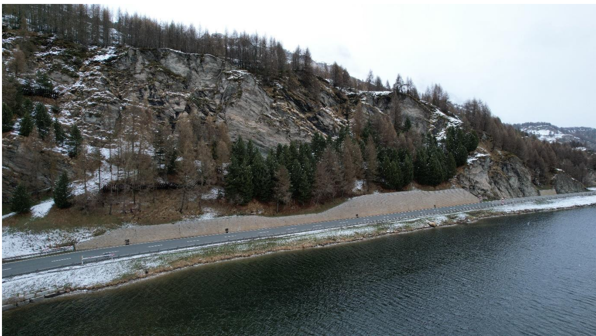
Abbildung 2 Drohnenaufnahme Objekt