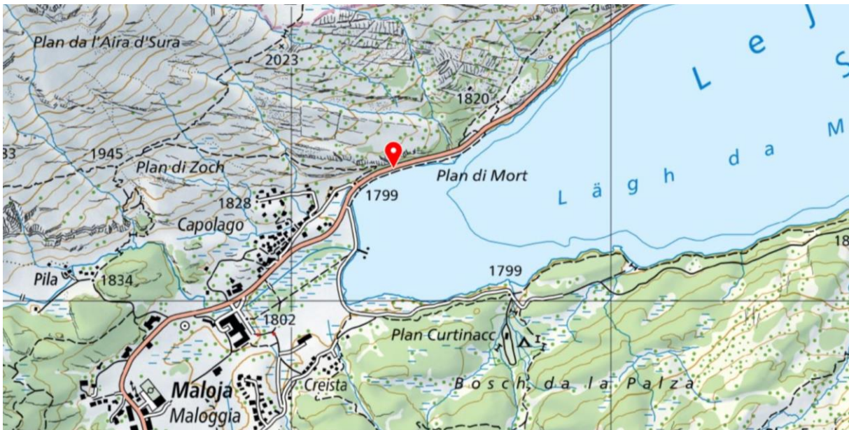
Abbildung 1 Kartenausschnitt