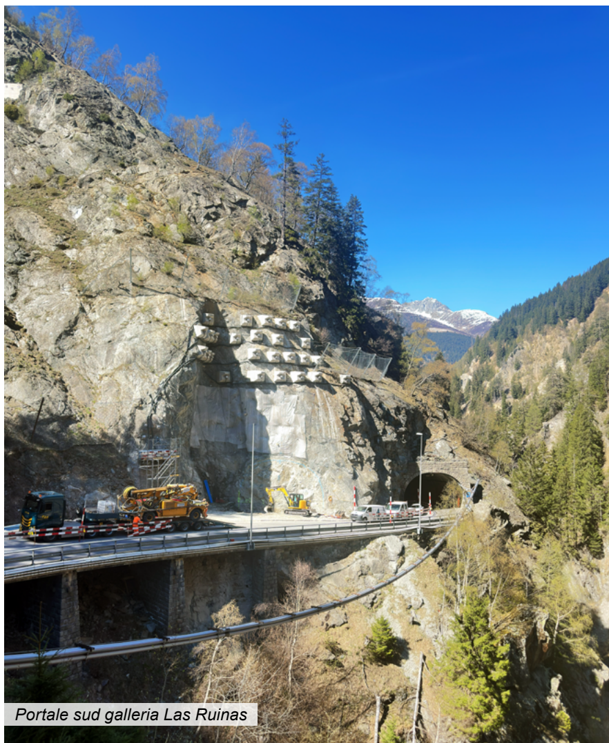
Portale sud galleria Las Ruinas

I costi del progetto ammontano a circa 32 milioni di franchi. L'elemento centrale del progetto è la galleria Las Ruinas, lunga circa 493 metri. La nuova galleria verrà realizzata parallelamente all'opera esistente e in futuro la sostituirà. Questo modo di costruire comporta un vantaggio