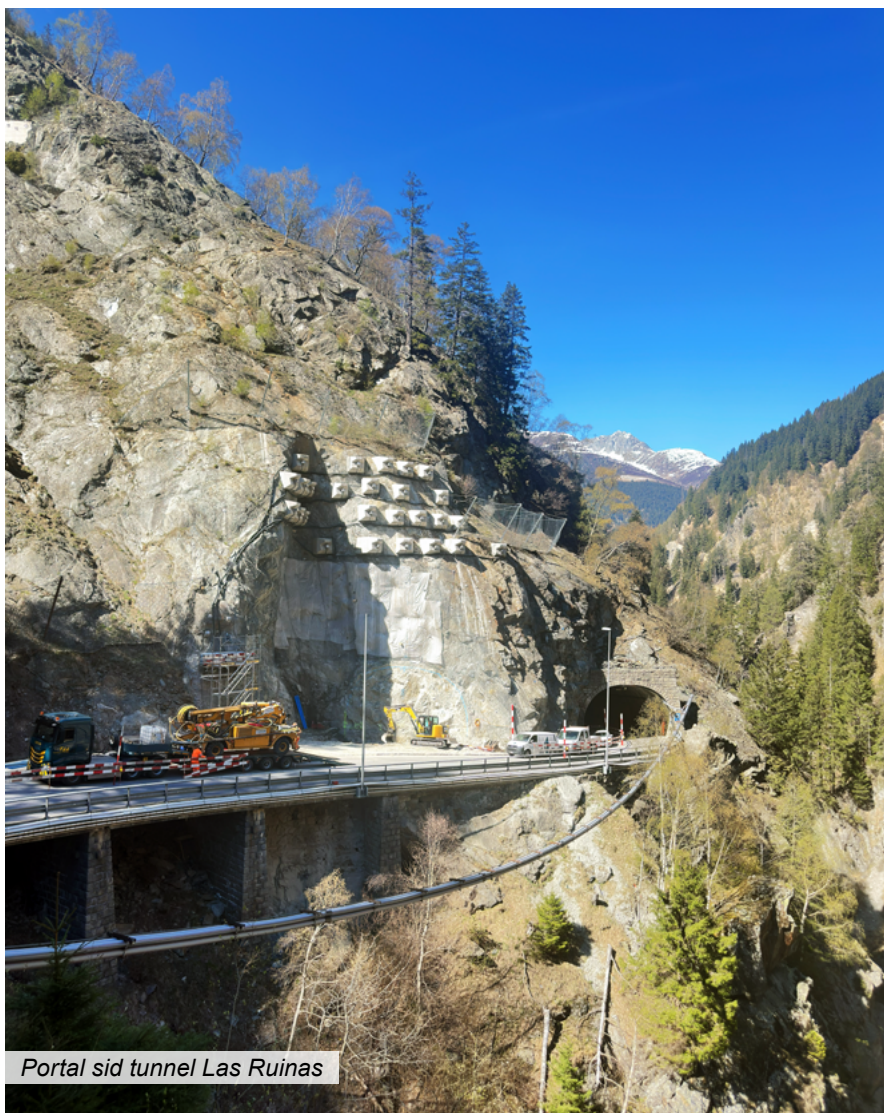
Portal sid tunnel Las Ruinas

La via dal Lucmagn è vegnida construida oriundamain en connex cun la construcziun da l'ovra idraulica ed è vegnida surdada al traffic il 1965. Dapi ils onns 1990 vegn la via renovada ed engrondda en etappas.