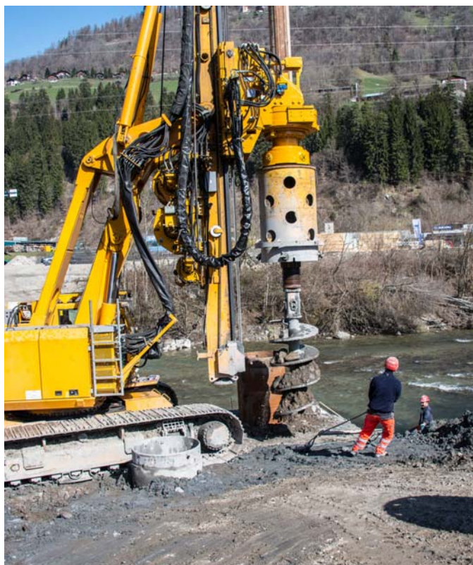
Bohren der Pfahlfundationen für die Widerlager