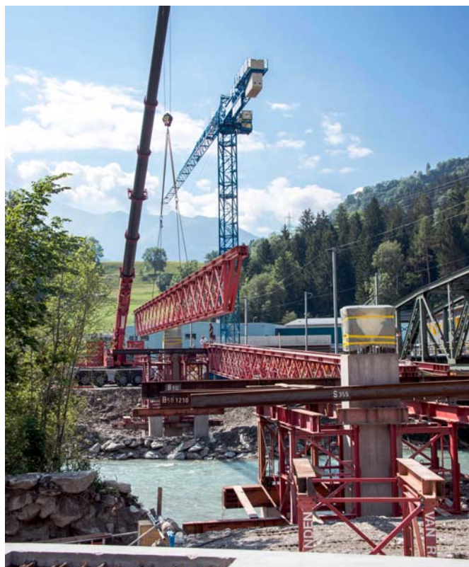
Montieren der Lehrgerüstträger für den Brückenoberbau