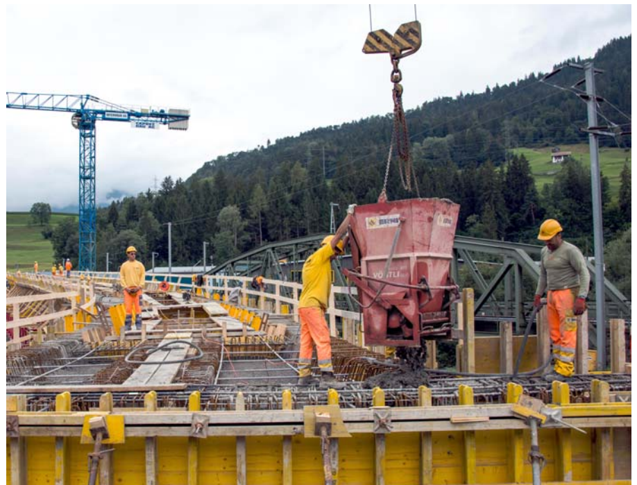
Betonieren der Brückenstege

Im nächsten Jahr wird im Gebiet Runcaleida der neue Kreisellugnezerstrasse mit allen Zufahrtsästen realisiert. Im Herbst 2015 können der Kreisellanz und die drei Zufahrtsäste Lugnezerstrasse, Valslerstrasse be-