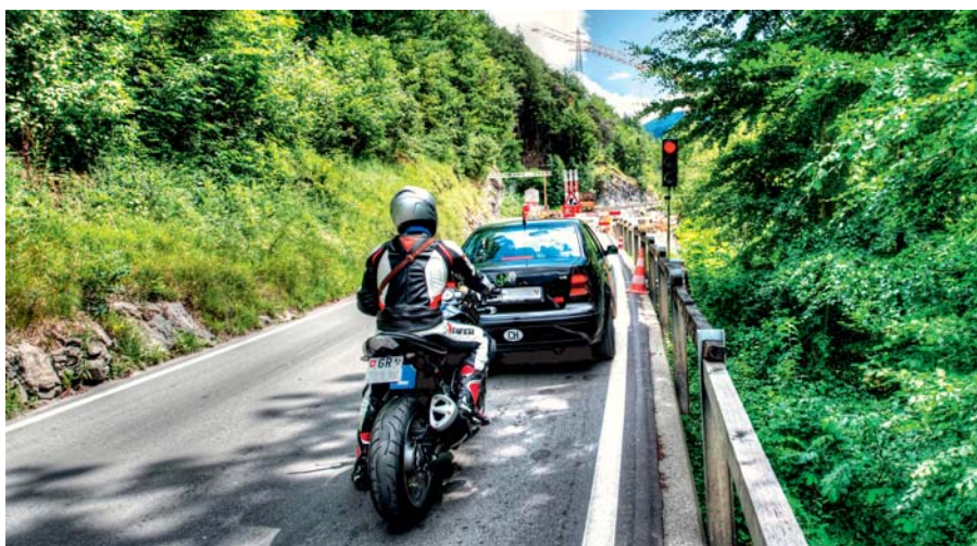
Regolazione del traffico lungo i cantieri mediante segnali luminosi

Queste misure volte alla conservazione delle nostre vie di trasporto sono purtroppo sovente associate a determinate e inevitabili restrizioni alla fluidità del traffico. L'Ufficio tecnico dei Grigioni attribuisce di conseguenza grande importanza alla gestione del traffico lungo i rispettivi cantieri. Le procedure vengono ottimizzate in modo da contenere il più possibile i disagi alla circolazione dovuti alla presenza del cantiere. L'Ufficio tecnico dei Grigioni fa tutto il possibile per evitare qualsiasi disagio lungo i principali assi di traffico, in particolare durante l'alta stagione. Per quanto possibile