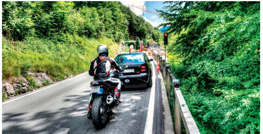
Regulaziun dal traffic a piazzals cun in'ampla

Questas mesiras per mantegnair nossas vias da traffic èn displaschaivlamain savens colliadas cun tschertas restricziuns inevitablas per la circulaziun dal traffic. Perquai dat l'Uffizi da construcziun bassa dal Grischun ina gronda paisa a la circulaziun dal traffic tar mintgin dals piazzals. Ils andaments vegnan optimads uschia ch'ils impediments durant la fasa da construcziun per il traffic sin via daventan uschè pitschens sco pussaivel. Oravant tut durant il temp principal da viagià sa stenta l'Uffizi da construcziun bassa dal Grischun en spezial da betg impedir il traffic sin las axas las pli impurtantas. Per las fins d'emna e durant il temp principal da viagià ve-