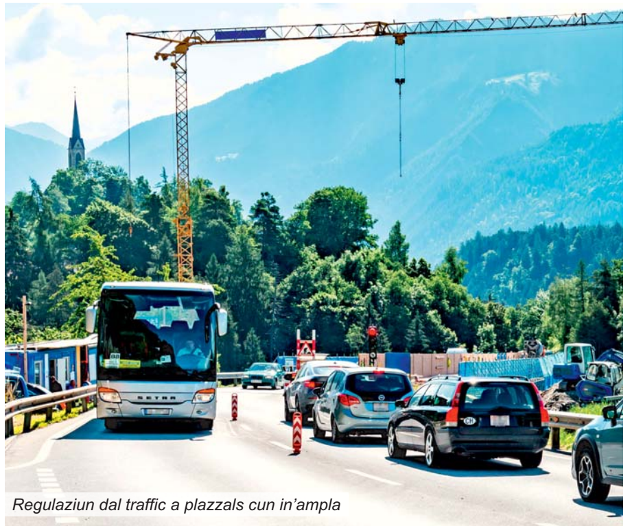
Regulaziun dal traffic a piazzals cun in'empla

Quests projects, che han l'intent da meglierar e da mantegnair nossa rait da vias chantunalas, chaschunan inevitablmain restricziuns temporaras da la buna circulaziun dal traffic. Perquai dat l'uffizi da construcziun bassa dal Grischun ina gronda paisa a la circulaziun dal traffic durant la fasa da construcziun. Ils andaments vegnan optimads, ed i vegn guardà ch'ils piazzals sajan libers durant las fins d'emna e durant il temp principal da viajar sco er ch'il traffic possa vegnir manà sin