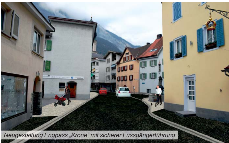
Neugestaltung Engpass „Krone“ mit sicherer Fussgängerführung

Der Auslöser für die Bauarbeiten sind nebst der sanierungsbedürftigen Strasse, der Ersatz der Wasserleitungen und die Verlegung von neuen