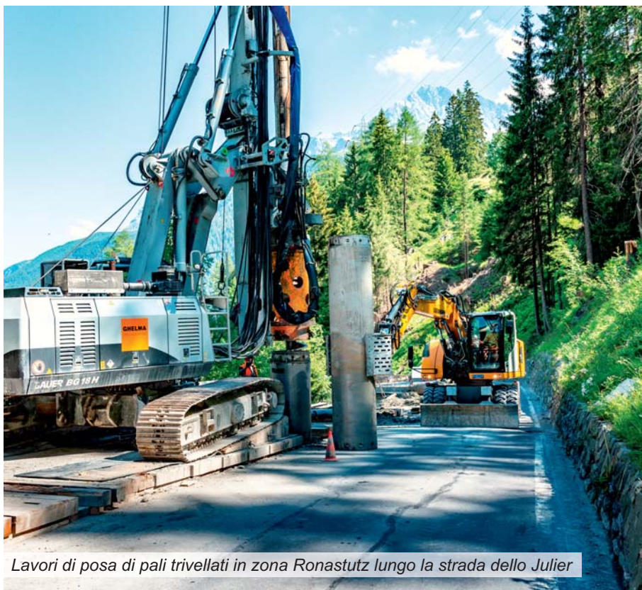
Lavori di posa di pali trivellati in zona Ronastutz lungo la strada dello Julier

Un cantiere riguarda il mio percorso casa-lavoro? La cartina e l'elenco dei cantieri aggiornati con informazioni dettagliate riguardo a lavori e disagi sono disponibili su www.strassen.gr.ch .