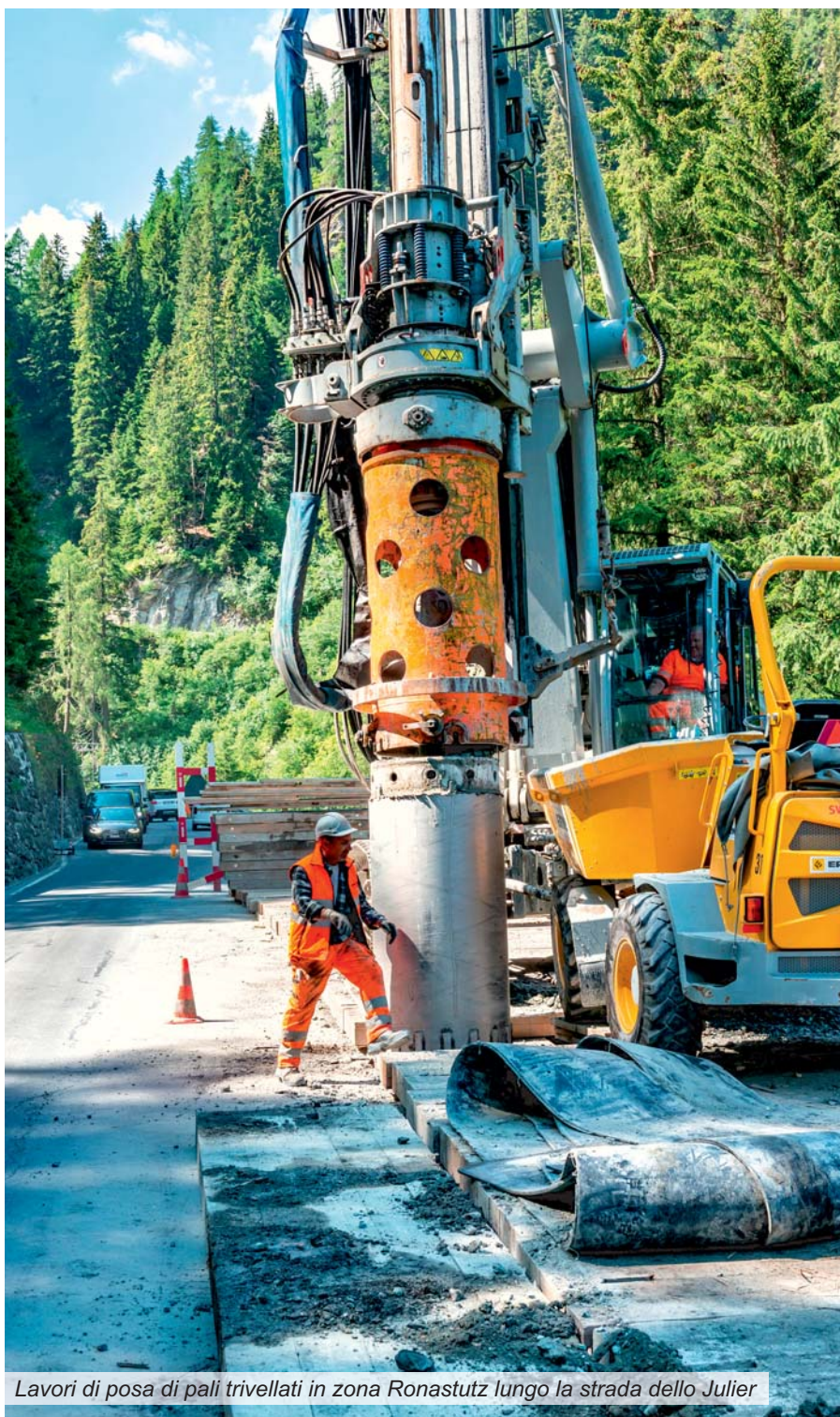
Lavori di posa di pali trivellati in zona Ronastutz lungo la strada dello Julier

Con le temperature più miti aumenta anche il numero dei cantieri stradali. In fin dei conti una rete stradale cantonale capillare, funzionante e sicura va a vantaggio di tutti, ciononostante questi cantieri possono comportare limitazioni e ritardi per chi in quel momento è costretto ad aspettare. I lavori sui cantieri stradali celano inoltre un rischio di incidenti non solo per gli utenti della strada, bensì anche per gli operai di imprese attive nella costruzione di strade e di servizi di manutenzione! Spesso il potenziale di pericolo viene sottovalutato o gli viene accordata troppa poca attenzione. Per questo motivo preghiamo gli utenti della strada di tenere un comportamento respon-