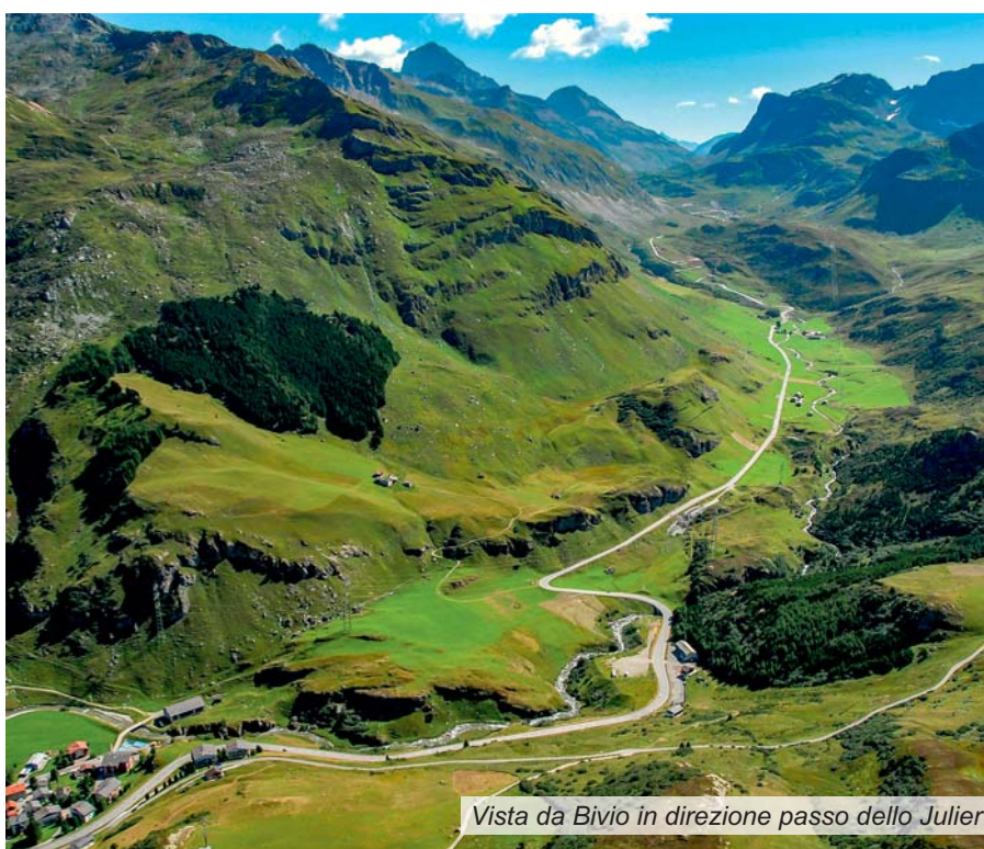
Vista da Bivio in direzione passo dello Julier

Nel piano settoriale dei trasporti del 26 aprile 2006, nella rete di base delle strade nazionali è stata inserita tra l'altro anche la strada nazionale Thusis – Tiefencastel – Silvaplana, già decisa in precedenza e prevista