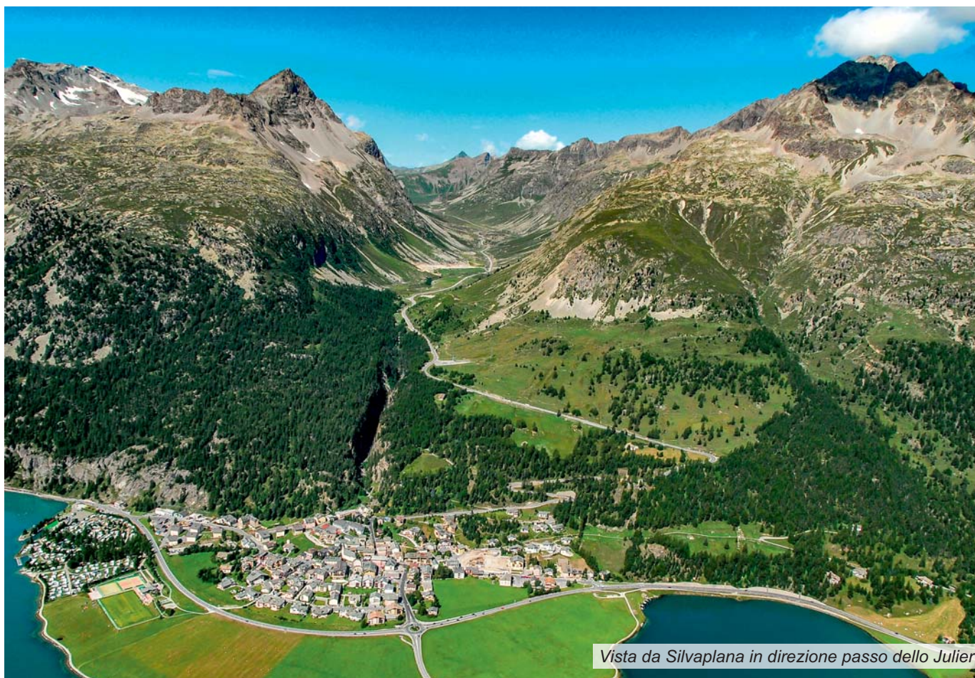
Vista da Silvaplana in direzione passo dello Julier

ienfeld e San Vittore, sin dalla sua realizzazione negli anni Sessanta, si tratta della N28 tra Landquart e Klosters/Selfranga, da quando è stata rilevata dalla Confederazione il 1° gennaio 2002, e quale novità della N29 da Thusis fino a Silvaplana, via Tiefencastel (vedi carta sinottica).