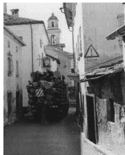
Il traffico pesante nel centro di Castasegna

ecologica del progetto per la circonvallazione, esso fu pubblicamente esposto nella primavera del 1994. La popolazione ha accettato all'unanimità la proposta dell'Ufficio tecnico cantonale; infatti l'assemblea comunale di Castasegna l'ha votata con 77 voti contro 0, esprimendo tuttavia il desiderio che entro termine utile venisse costruita, in collaborazione con l'Italia, la nuova stazione doganale e che il progetto viario venisse adeguatamente adattato. Per contro l'Ufficio federale dell'ambiente, delle foreste e del paesaggio fu del parere di non poter, in base alla legge sulla protezione della natura e del paesaggio, approvare senza riserve l'allacciamento est al nuovo viadotto sul Caroggia. Ciò nonostante, dopo dispendiosi e circostanziati accertamenti, limitando l'allacciamento est ad una uscita e rinunciando al viadotto, è stato possibile trovare una soluzione accettabile per tutti gli oppositori. Ora che il Governo grigio-