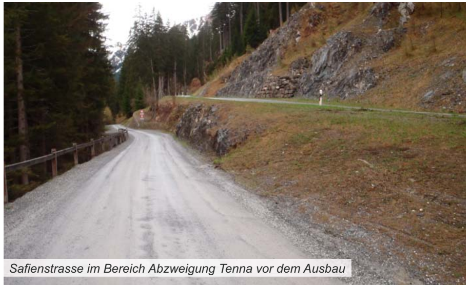
Safienstrasse im Bereich Abzweigung Tenna vor dem Ausbau

Dass der rund sechs Kilometer lange Strassenabschnitt Schäden aufweist, hängt unter anderem mit der fehlenden Frostsicherheit zusammen. Die frühere Naturstrasse wurde zur Verminderung der Staubentwicklung vor einigen Jahren mit einem Belag versehen. Weil diese Massnahme damals schon als Übergangslösung bis zum definitiven Ausbau der Strasse gedacht war, wurde auf den Einbau eines frostsicheren Unterbaus verzichtet. Das Tiefbauamt setzt nun alles daran, die Mängel schnellstmöglich zu beheben, die Sanierung voranzutreiben und