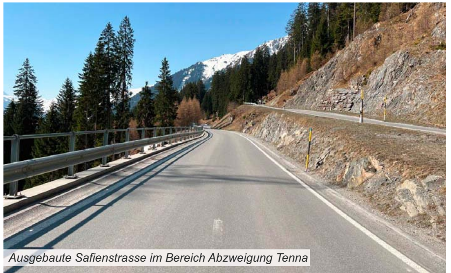
Ausgebaute Safienstrasse im Bereich Abzweigung Tenna

gleichzeitig die Strasse streckenweise auszubauen. Weil dies jedoch erst nach dem Ausbau der Strasse im vorderen Talabschnitt möglich ist (siehe weiter hinten im Text), werden zur Überbrückung bis dahin noch dieses Jahr Sofortmassnahmen getroffen. Es ist vorgesehen, auf dem Abschnitt zwischen Safien Platz und Safien Thalkirch in den Monaten Juni und Juli bei neun besonders betroffenen Passagen den