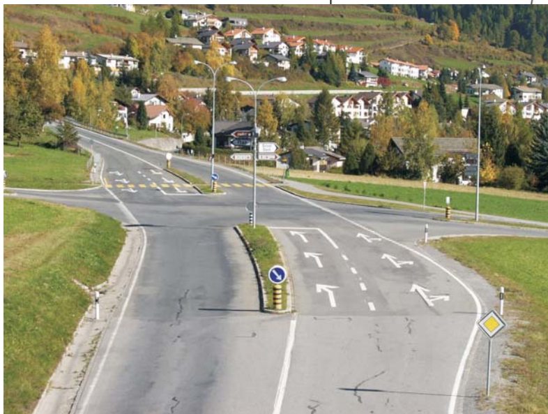
Der neue Kreisel an der Engadinerstrasse in der Situation

Während der Bauzeit bleibt die Engadinerstrasse zweispurig befahrbar. Die Bahnhofstrasse ist zwischen dem Knoten des Marktplatzes beim Bahnhof bis rund 200 Meter unterhalb des Knotens zur Engadinerstrasse nur einspurig befahrbar. Eine Umleitung ist signalisiert. Es wird alles daran gesetzt, mit optimierten Bauabläufen die Verkehrsbehinderungen und die Bauzeit auf ein Minimum zu reduzieren. Das Tiefbauamt Graubünden hofft auf das Verständnis aller Verkehrsteilnehmenden und Betroffenen.