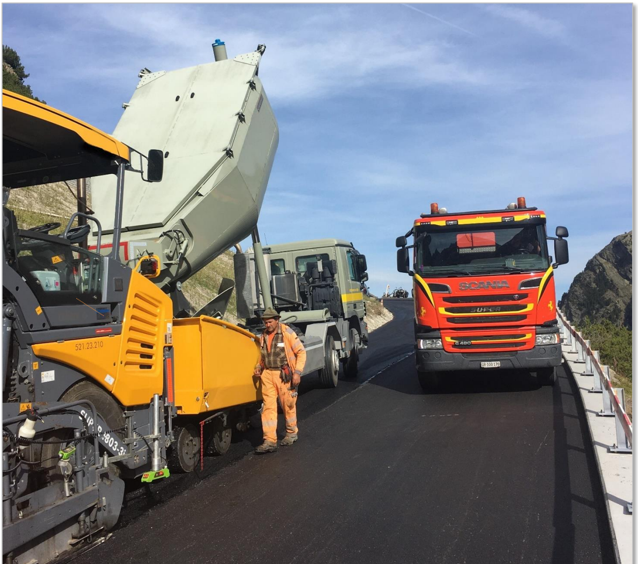
H28 b Flüelastrasse IS Wendekehren Chant Sura km 16.45-17.00