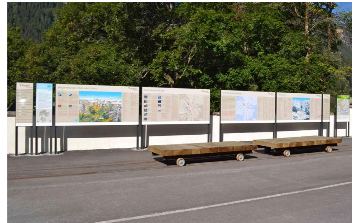
Das Informations- und Leitsystem in Bergün im Design der Marke Graubünden.

Das Tiefbauamt Graubünden, Fachstelle für Langsamverkehr regelt die Farbgebungen der Wegweiser ( www.langsamverkehr.gr.ch ). Im Online-Handbuch der Fachstelle sind die Dokumente und Unterlagen für Ausbau und Unterhalt des Langsamverkehrs zusammengestellt.