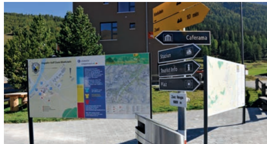
Geordnete Informationspunkte in Zuoz. Neue Ortspläne werden mit bestehenden Informationen (z.B. Bikekarten, Vitaparcours) kombiniert und zu einer Einheit verbunden.

In Graubünden erfolgt die Ausführung der Wegweiser in hochwertigem, robustem Alu-Reliefguss nach dem RAL-Farbkatalog. Diese Ausführung ist wetterbeständig, auch hochalpin einsetzbar und weist bei gleichen Kosten eine fünfmal längere Lebensdauer auf als andere Systeme. Wo immer möglich, werden die Wegweiser an bestehenden Trägern angebracht (Ortswegweiser, Verkehrsschilder, Strassenbeleuchtungen, Strom- und Telefonmasten). Für die Befestigungen der Schilder an verzinkten Eisenrohren werden Briden und Schilderhalter aus rostfreiem Material verwendet.