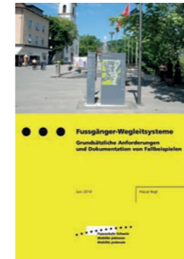
«Fussgänger-Wegleitsystem» der Fachstelle Fussverkehr Schweiz.