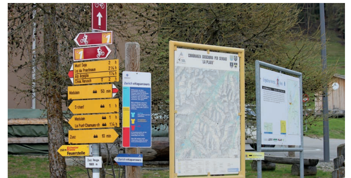
Über Jahre gewachsene Orientierungssysteme.