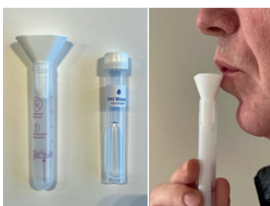
Test salivare PCR

Al fine di organizzare in modo il più possibile efficiente l'intero processo, vengono effettuati test salivari PCR. Questi test sono estremamente facili da utilizzare e possono essere svolti autonomamente senza aiuto specialistico. Inoltre il trasporto non presenta problemi e lo svolgimento del test richiede soltanto un paio di minuti.