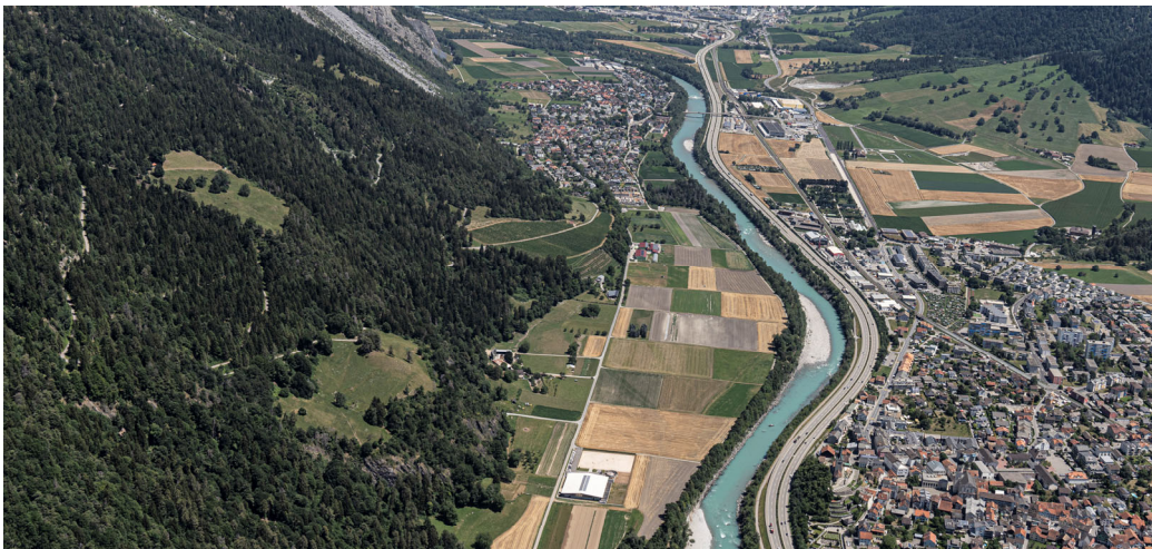
Immagine 1: Gestione agricola nello spazio riservato alle acque a Felsberg e Domat/Ems, fonte: Ufficio per lo sviluppo del territorio dei Grigioni, foto: Andrea Badrutt

In agriGIS nonché nel WebGIS cantonale è disponibile una cartina che mostra gli spazi riservati alle acque passati in giudicato. La gestione agricola di questi spazi è vincolante.