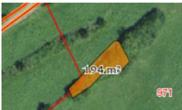
III. 6: estratto di una superficie digitalizzata sul geoportale

Sul geoportale possono essere consultate tutte le misure QP. Esiste anche la possibilità di digitalizzare le superfici curate sullo schermo; la rispettiva superficie viene visualizzata direttamente. Prenda per favore in considerazione le istruzioni di appartenenza.