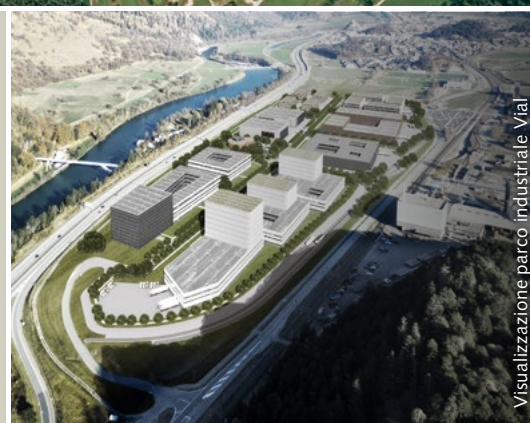
Visualizzazione parco industriale Vial