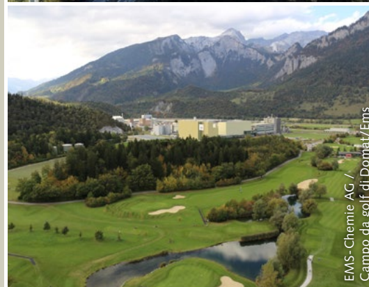
EMS-Chemie AG / Campo da golf di Domat/Ems

La piazza economica all'incrocio tra gli assi di transito