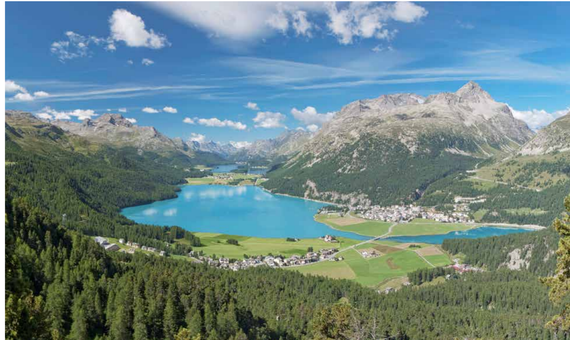
Vista sui laghi dell'Engadina Alta

Trasporti pubblici www.rhb.ch | www.sbb.ch