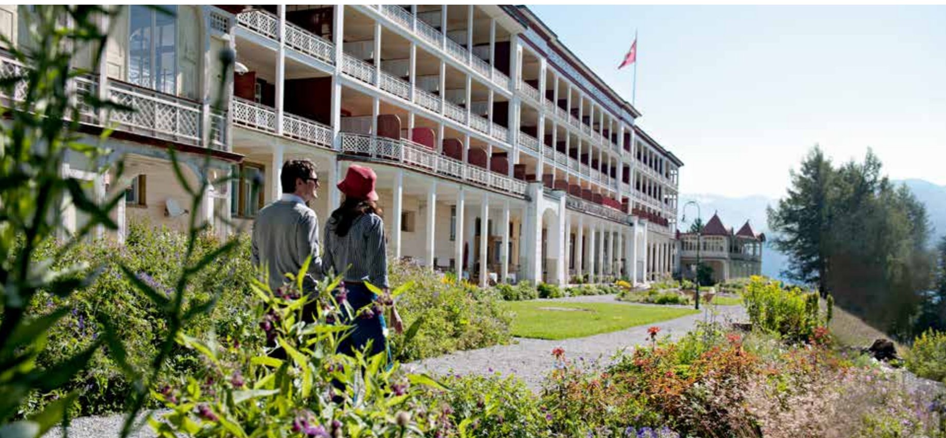
Hotel Schatzalp, Davos (tra l'altro già set di film hollywoodiani)