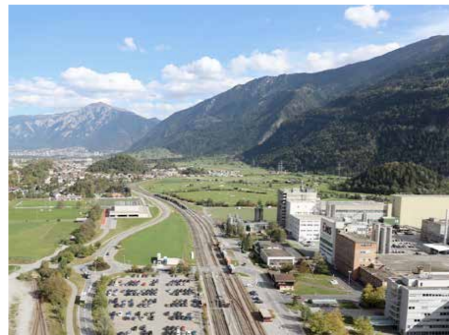
Zona industriale Domat/Ems