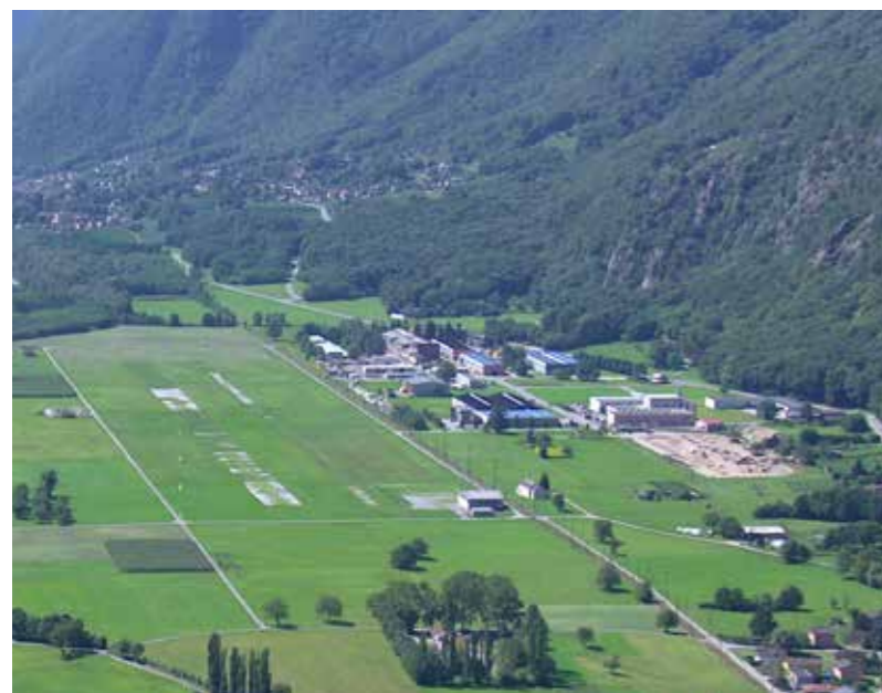
Zona industriale San Vittore

«Quale ditta start-up vogliamo sviluppare i nostri prodotti là dove si trovano condizioni ideali per promuovere l'innovazione.»