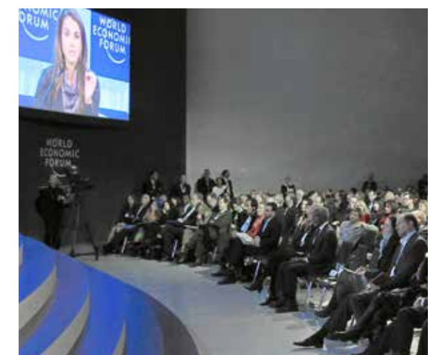
World Economic Forum (WEF), Davos

Fonti: IMD 2013, statistica grigionese nonché Global Competitiveness Report 2015 del WEF