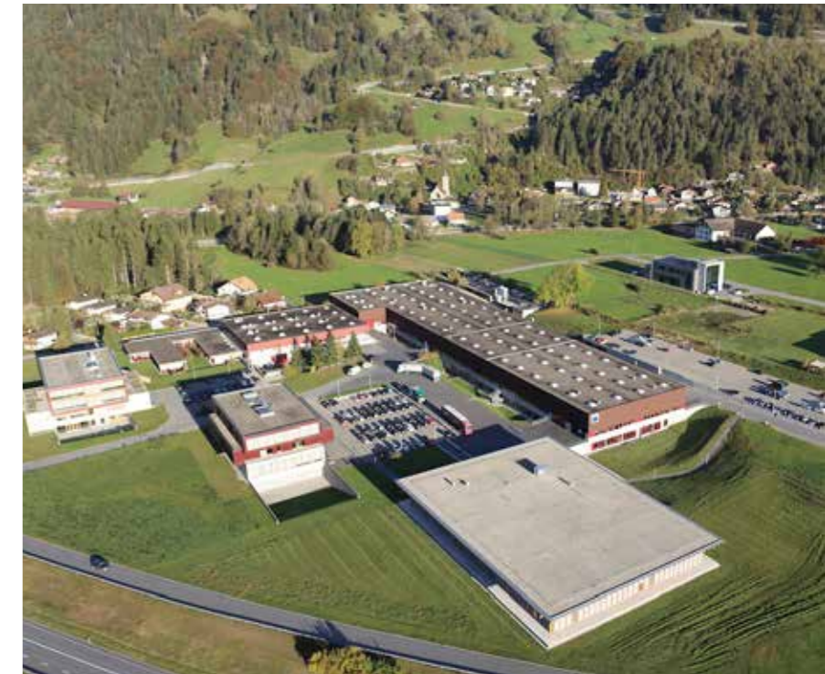
Zona industriale Prättigau

Durante il periodo di prova, che può durare fino a 3 mesi, il rapporto di lavoro può essere disdetto in ogni momento con un termine di disdetta fino a 7 giorni. In seguito il termine di disdetta ammonta a 1 mese per i rapporti di lavoro in essere da meno di un anno. Dal 2° al 9° anno di servizio il termine di disdetta è di 2 mesi e in seguito di 3 mesi. Sono ammessi anche termini di disdetta più lunghi. Il diritto del lavoro svizzero prevede una protezione dal licenziamento solo per pochi casi. Si distingue tra una protezione contro disdette abusive e una protezione contro disdette date in tempo inopportuno.