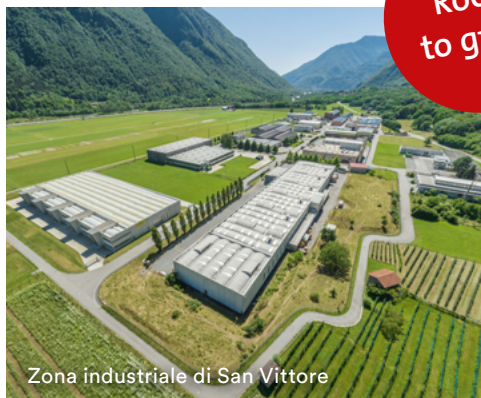
Zona industriale di San Vittore