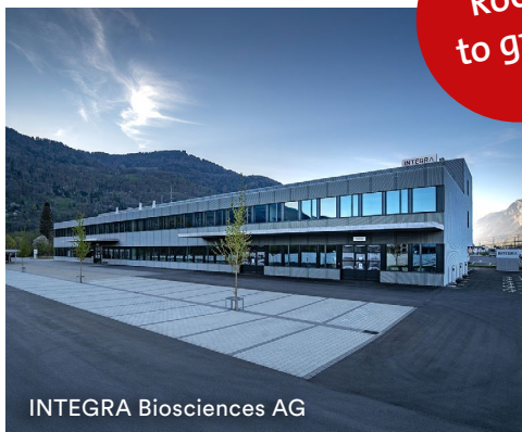
INTEGRA Biosciences AG