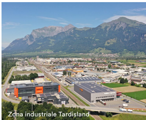
Zona industriale Tardisland