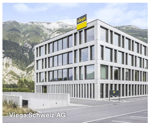
Viega Schweiz AG