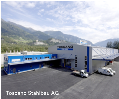
Toscano Stahlbau AG